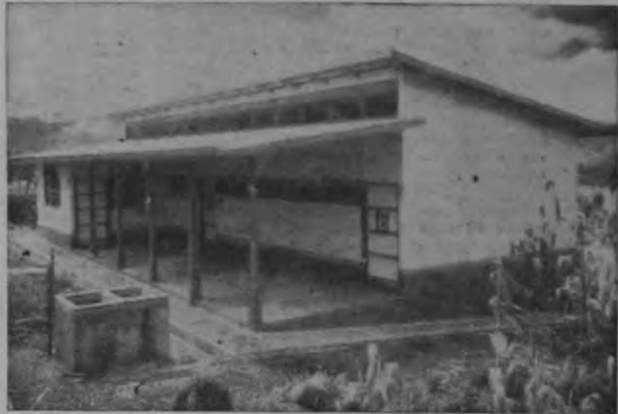
ESCUELA DE BIRRISITO DE PARAISO, construida por el Ministerio de Obras Públicas con un costo aproximado de ₡ 25.000. Consta de 2 aulas, Dirección y completos servicios sanitarios. En esta forma la actual Administración favorece nuestra población escolar.