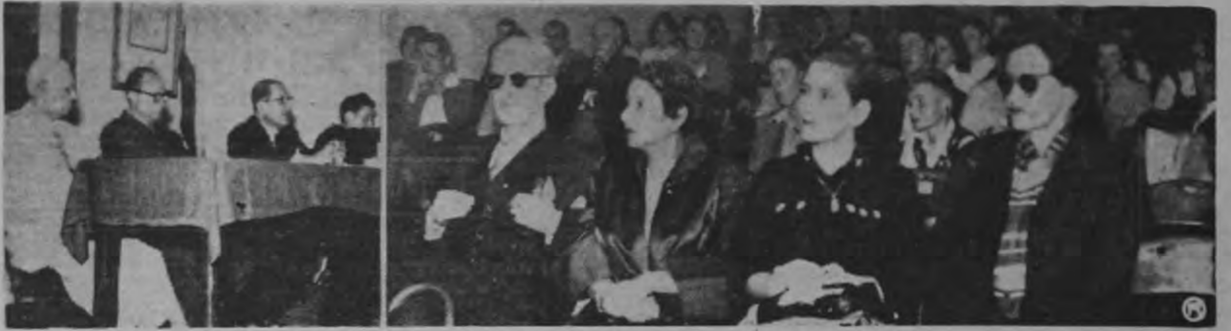
BRILLANTE CONFERENCIA DEL EMBAJADOR DE ECUADOR EN COSTA RICA. —Parte de la selecta y numerosa concurrencia de Ecuador en Costa Rica, quien disertó en la Sociedad Juvenil Ispasado.

Un numeroso público escuchó la disertación con especial interés y aplaudió al final al distinguido conferencista.