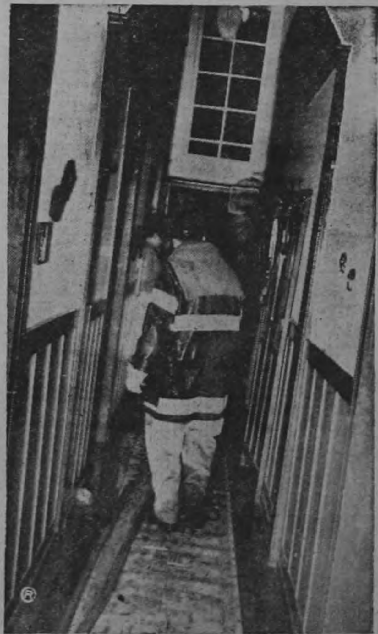
OFICIAL REvisa TABIQUES SOSPECHOSOS — Controlado ya el fuego, miembros del equipo especial revisan cuidadosamente los tabiques y lugares susceptibles de mantener fuego latente, para eliminar cualquier posible rescoldo peligroso. Treinta minutos de lucha bastaron para conjurar el peligro de un incendio quizás de grandes proporciones.