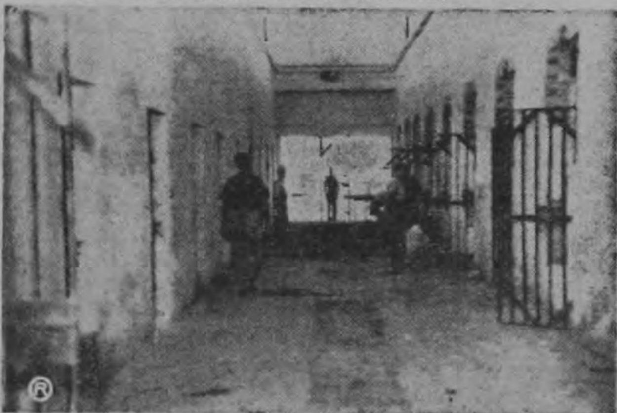
Una sección de las 23 celdas que están acondicionándose para reos rematados.

Para el Estado esto es un problema gravísimo. Tarde o temprano debe encauzarse esta prisión para que sea más útil porque en la forma en que está la Peni, no regenera sino degenera a un elevado porcentaje de los detenidos.