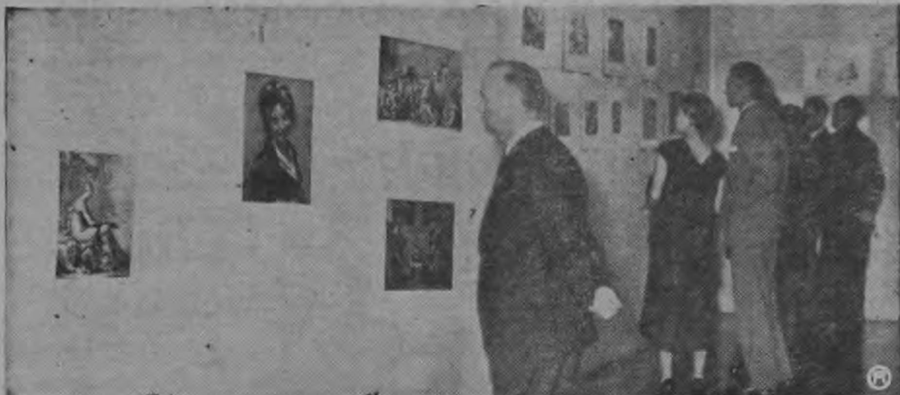
Vista parcial de la pared de un salón de la exposición de pinturas francesas en la magnífica exposición que abrió ayer en el Museo Nacional la Alianza Cultural Franco-Costarricense.

La Alianza Cultural Franco-Costarricense se ha anotado un sonoro triunfo con la estupenda exposición de pinturas francesas que abrió ayer en el Museo Nacional.