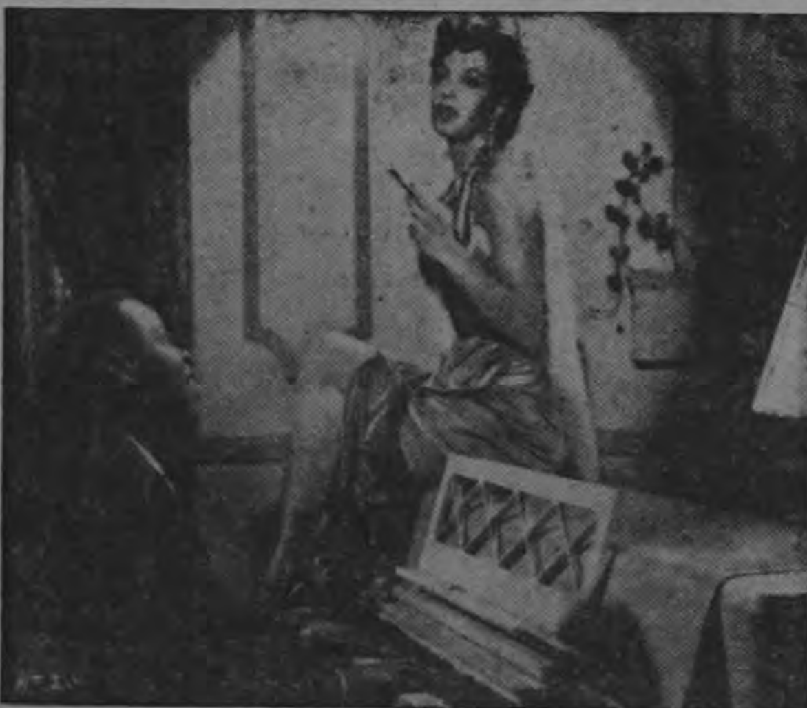
LOS BRIBONES los más famosos cantantes mexicanos y su órgano!

son reunidos en la apasionante vida de un campeón de boxeo que peleó entre el amor de dos mujeres! Una historia llena de fogosa realidad, de tremendo y delirante interés, y apasionamiento!